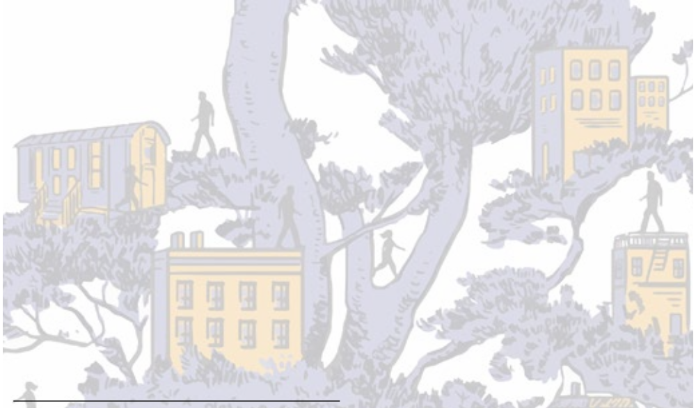
Illustration de couverture : © Valentin Prévot

Ces travaux n'auraient pu aboutir sans la mobilisation de différents groupes de travail, successifs et concomitants, réunissant équipes des unions régionales et nationale et surtout porteurs de projet Habitat Jeunes : qu'ils soient tous vivement remerciés de leur participation à cette réflexion transverse, protéiforme, qui n'a de cesse d'évoluer.